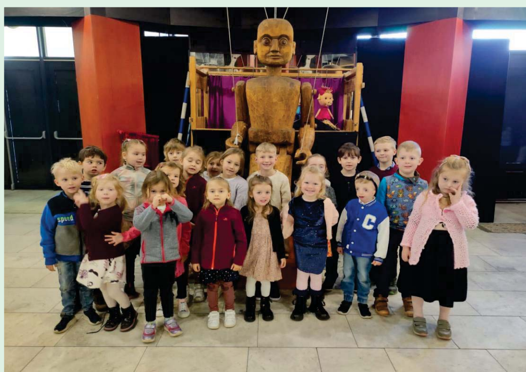
Na jaře se děti vydaly za kulturou do mosteckého divadla Rozmanitostí, kde shlédly krásné divadelní představení „Povídání o pejskovi a kočičce.“ Na rozloučenou je čekala ještě prohlídka marionet.